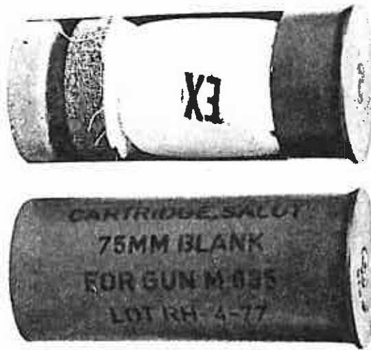
طلقة تدريب ٧٥ ملم مع علامات الحاوية