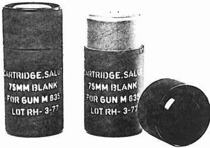
خرطوشة تعية ٧٥ ملم ، خلبية مع حاوية وعلامات الحاوية