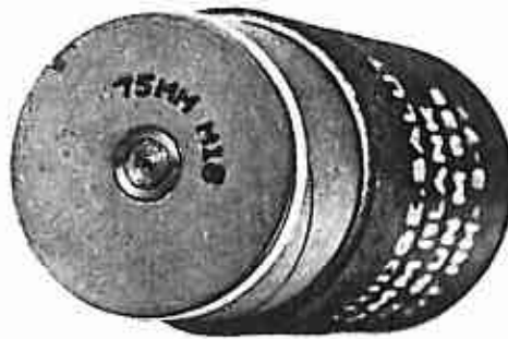
قاع الطلقة يحمل العلامة (٧٥ مم م ١٨) وتظهر كبسولة القذح د/ م ٦٤